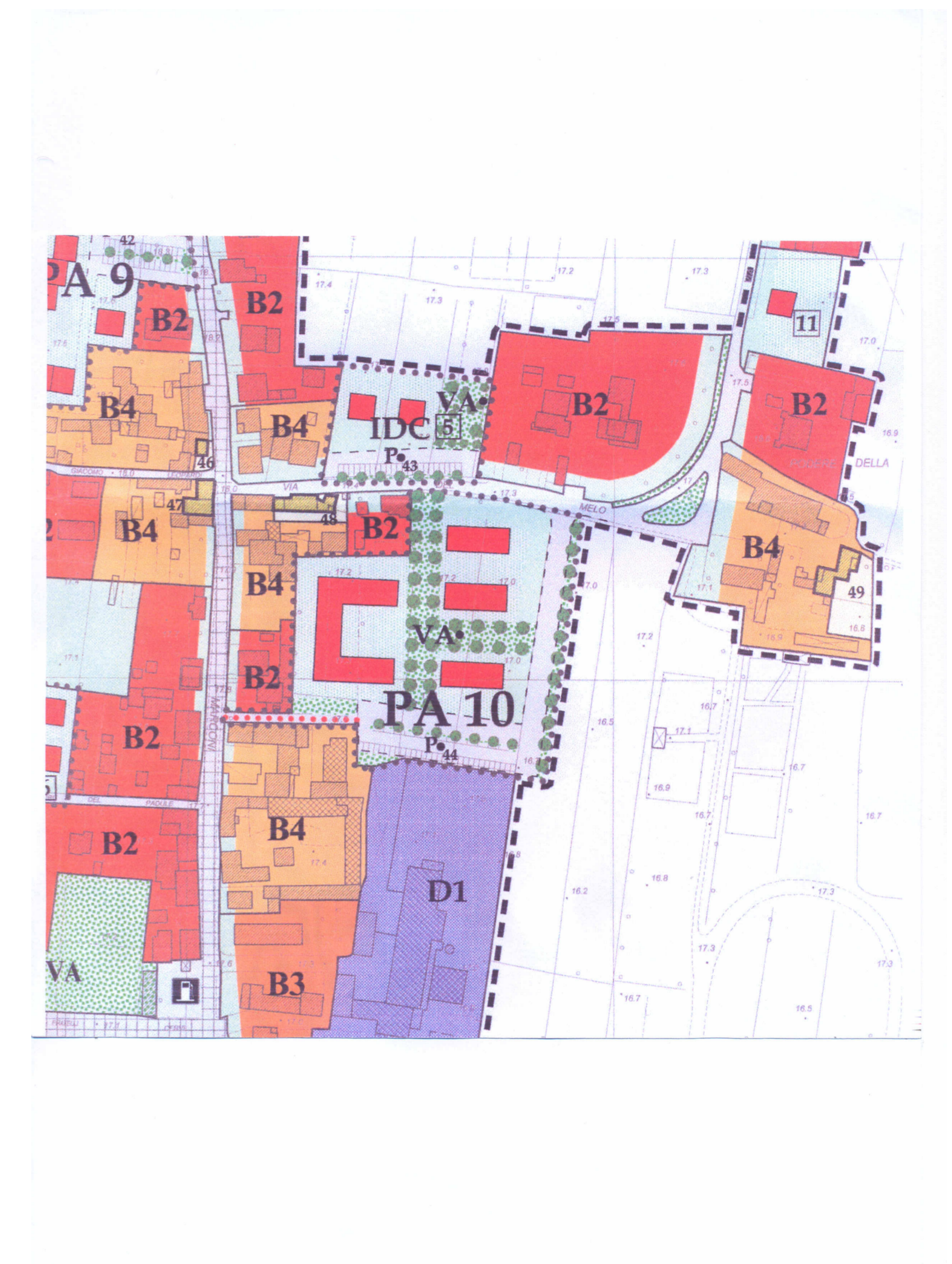
ESTRATTO REGOLAMENTO URBANISTICO