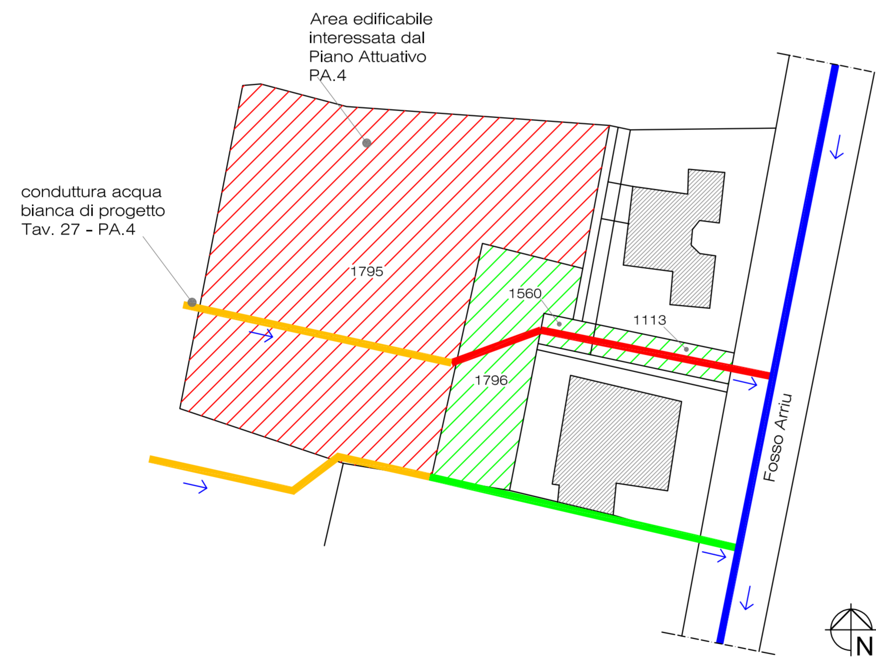
Schema particellare area interessata dalla conduittura di progetto scala 1:500