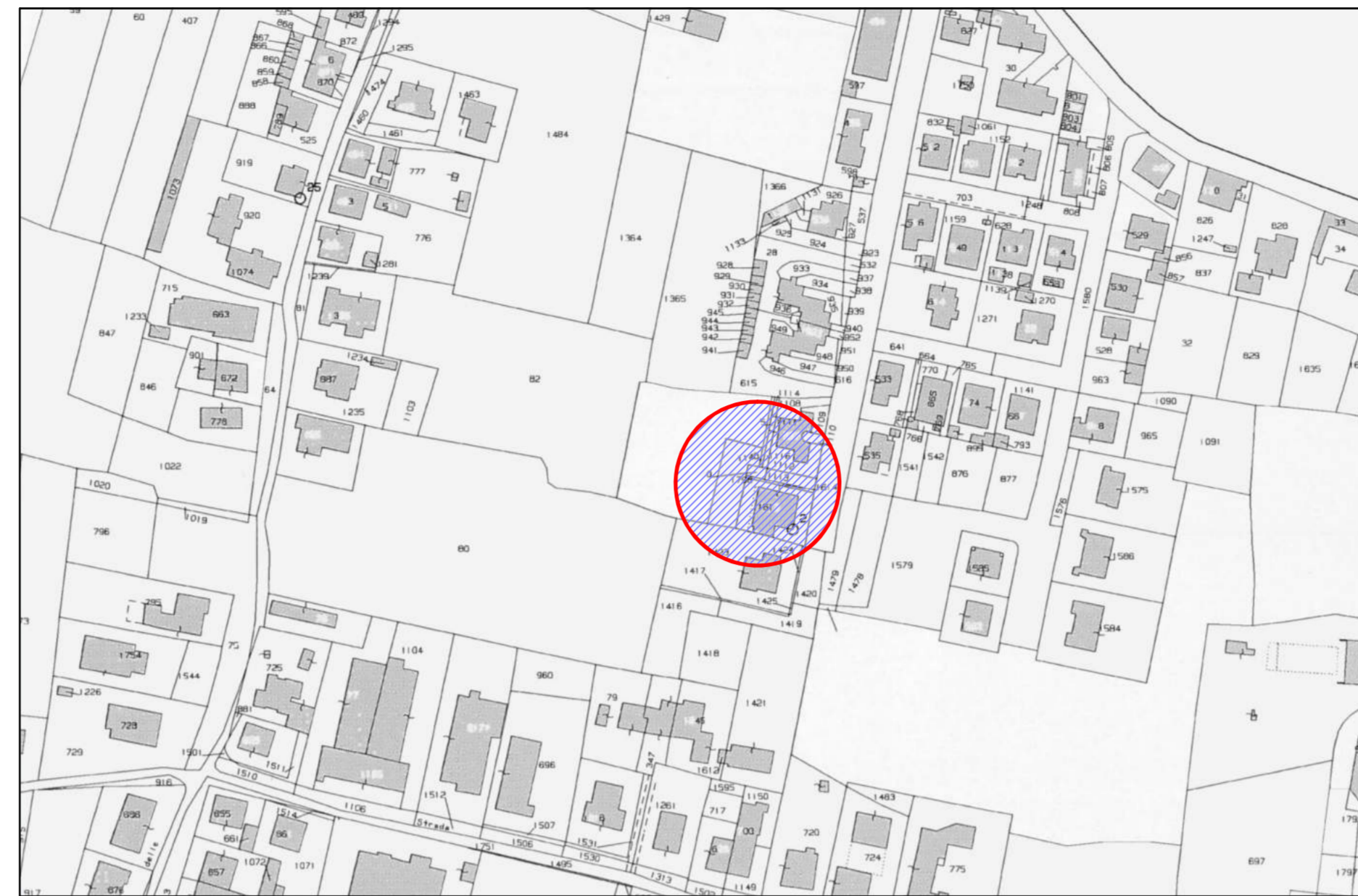
ESTRATTO DI MAPPA CATASTALE - scala 1:2000 Comune di Pieve a Nievole (Catasto Terreni) Foglio 8, Particelle 1113, 1560, 1795 e 1796