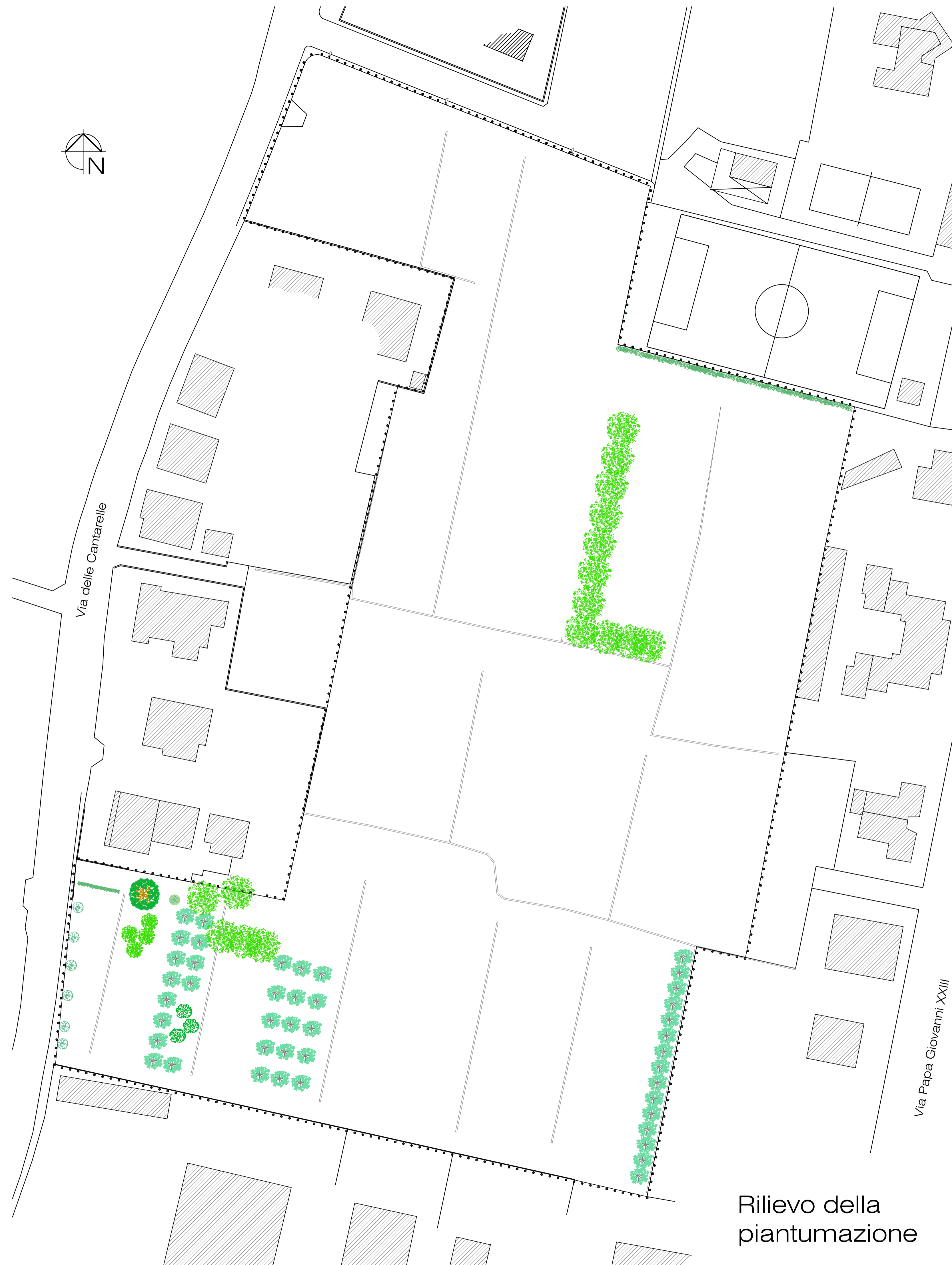
Rilievo della piantumazione

Via G. Morini, 1 51018 Montecatini Terme (PT) Tel. 0572 951243 Cell. +39 338 9546338