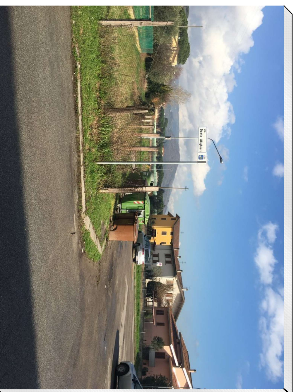
Vista lato sud del terreno da via Dante Alighieri