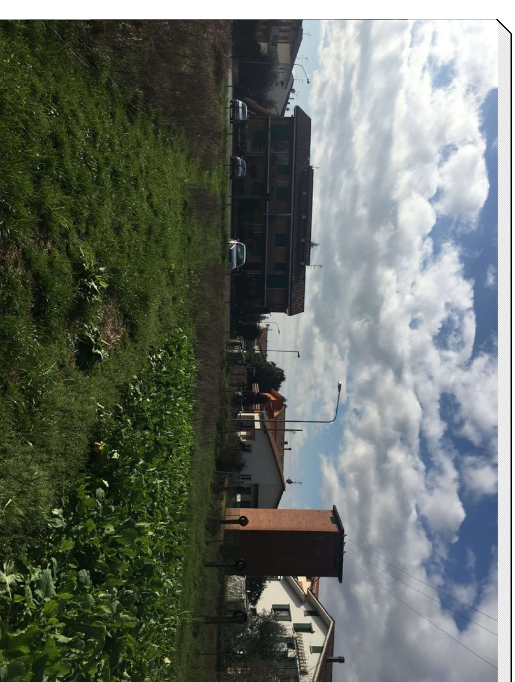
Vista porzione sud del terreno da punto di ripresa interno al lotto