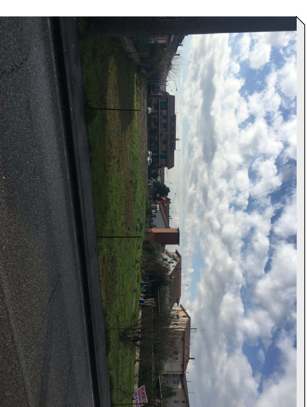
Vista lato nord del terreno da via A. Gramsci