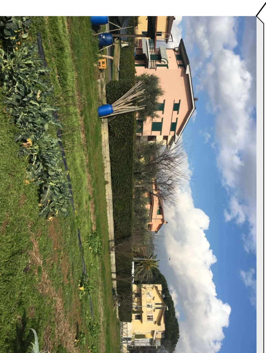
Vista porzione nord ovest del terreno da punto di ripresa interno al lotto