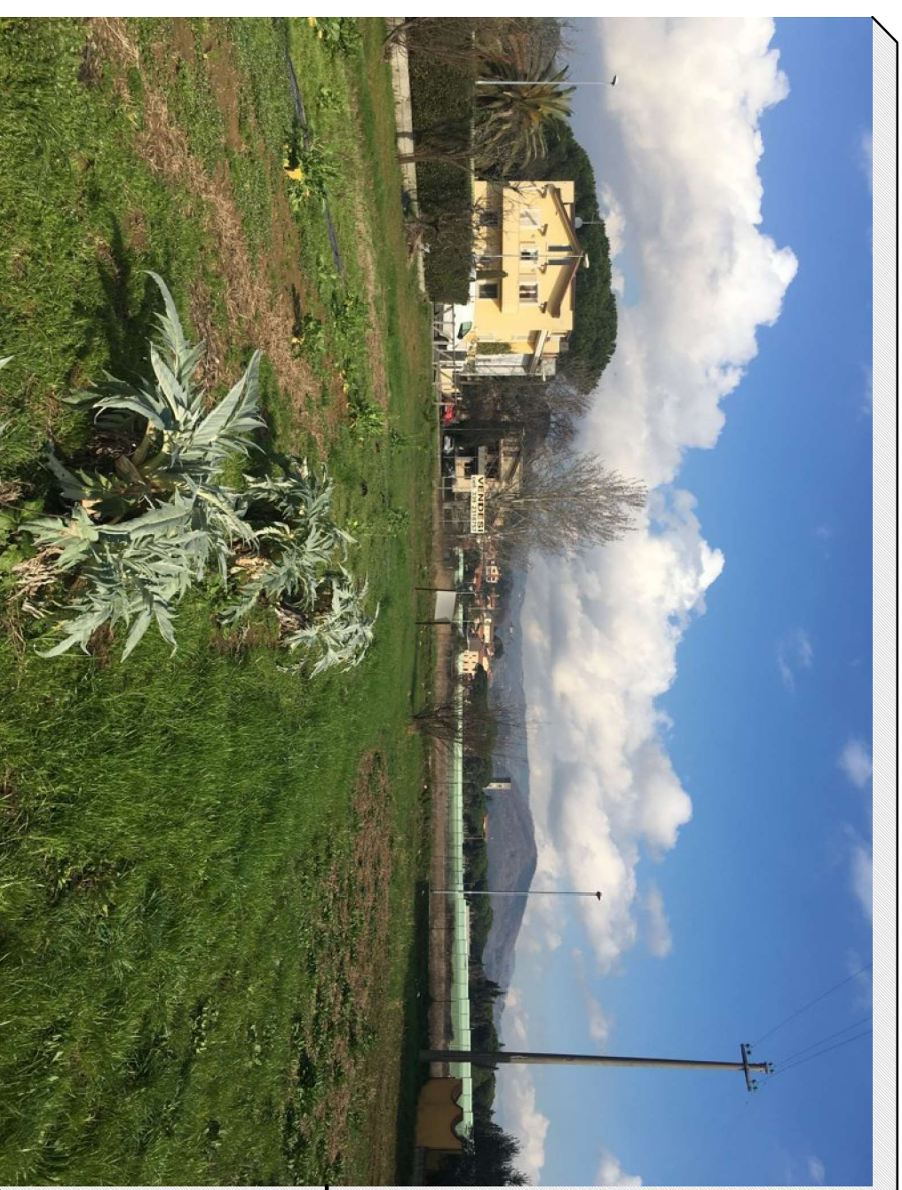
Vista porzione nord del terreno da punto di ripresa interno al lotto