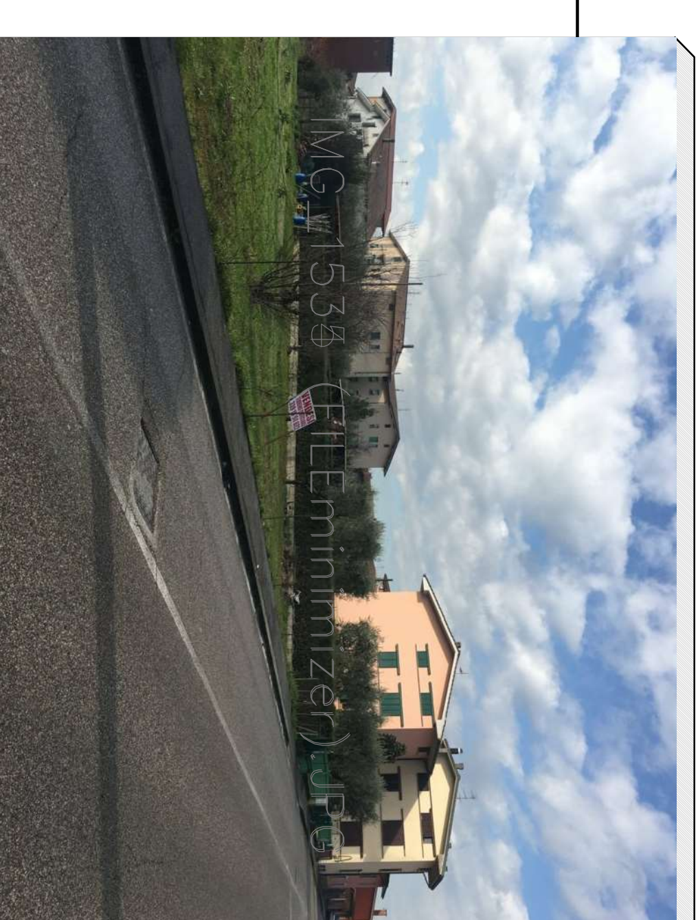
Vista porzione nord del terreno da punto di ripresa interno al lotto